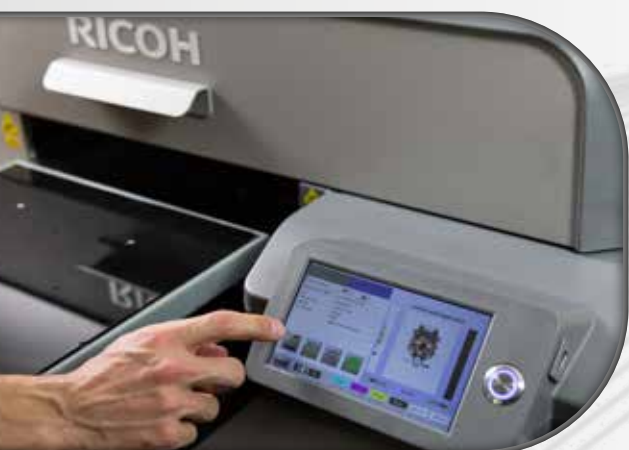
Pannello di controllo touch screen