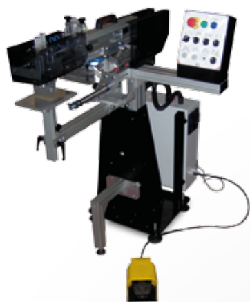
Dettaglio quadro comandi

Macchina serigrafica adatta per stampa su oggetti a superficie piana